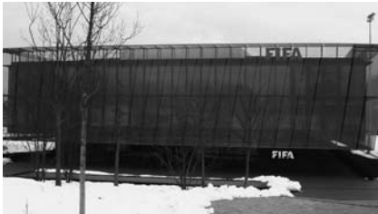
Home of FIFA

Heerenschürli – Le Heerenschürli à Schwamendingen est l’un des trois plus grands complexes sportifs de la ville de Zurich. Des travaux y sont actuellement effectués en vue d’optimiser son infrastructure. Le centre va ainsi s’enrichir d’un terrain de baseball satisfaisant aux normes exigées pour l’organisation de compétitions, d’un bâtiment abritant des vestiaires, un restaurant et une tribune et d’un terrain de football supplémentaire. La construction du terrain de baseball est cofinancée par la Confédération dans le cadre de sa conception pour les installations sportives d’importance nationale (CISIN).