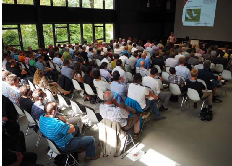
Bundesamt für Sport BASPO Eidgenössische Hochschule für Sport Magglingen EHSM