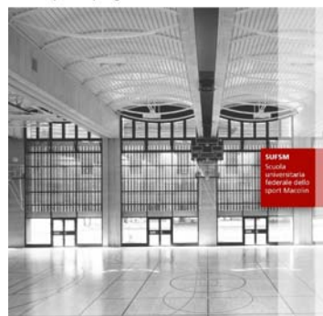
201 – Palestre Basi per la progettazione

Ufficio federale dello sport UFSPO Eidgenössische Hochschule für Sport Magglingen EHSM