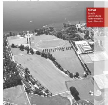
001 – Impianti sportivi Basi per la progettazione