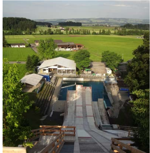
Bundesamt für Sport BASPO Sportpolitik und Ressourcen