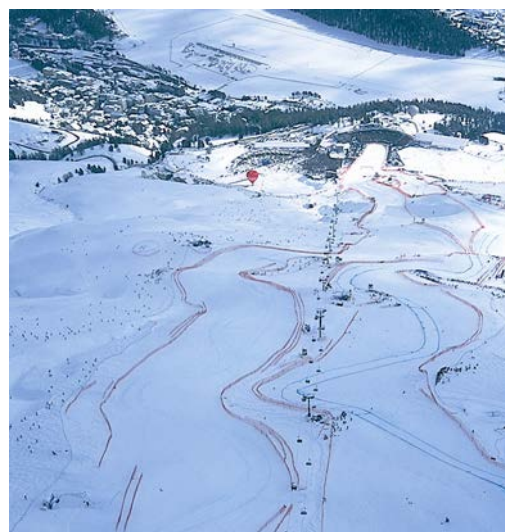
Bundesamt für Sport BASPO Sportpolitik und Ressourcen