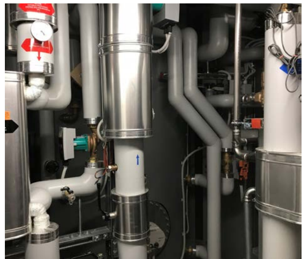
Bundesamt für Sport BASPO Sportpolitik und Ressourcen