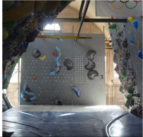
Bundesamt für Sport BASPO Sportpolitik und Ressourcen